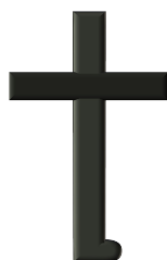
Fig. 3 SHI – termen folosit în medicina tradițională extrem orientală ce simbolizează o stare caracteristică YANG

A doua ideogramă – YIN, are de asemenea două părți ce se întrepătrund și care se formează din două ideograme ce se transformă.