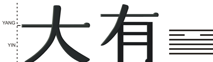
Fig.1 – Hexagrama DA YOU

Deși sistemul hexagramelor este considerat de milenii un sistem de previziuni, astrologic, vom vedea că sensurile acestora depășesc cu mult această concepție, fiind legate de însăși energia "QI" care este generată din principiul TAIJI a cărui manifestări sunt date de aspectele principiale ale vieții și de parcursul acesteia.